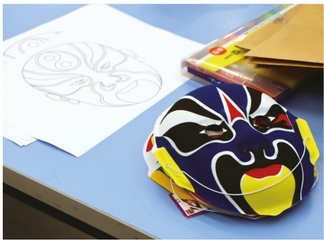
● 同學們設計的川劇臉譜

設計所代表的角色性格。期間，同學們均踴躍發言，各抒己見，討論氣氛熾熱。兩地學生其後更共同構思臉譜的新設計，利用不同顏料，搭配色彩，製作獨一無二的臉譜。作品完成後，同學們戴上親自創作、別出心裁的臉譜，配合選定的川劇服飾，搖身一變成為川劇主角，興味盎然，無不樂在其中。