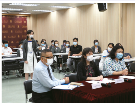
● 同學在「悅」讀 FUN 享會踴躍發言

趙中日後會舉辦更多跨科組或小組的閱讀推廣活動，讓同學愛上閱讀，並跳出傳統閱讀模式的框框。該校亦計劃與其他姊妹學校合辦朗讀、「有聲好書」及故事人物繪畫比賽等活動，鼓勵兩地同學互相切磋，共同提高個人文化素養，進一步推廣閱讀風氣。