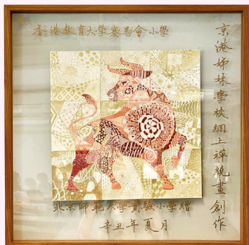
● 以牛年為主題的禪繞畫

學非常主動，而且點評的水準很高，內地同學的互評文化着實值得香港學生學習。」課後，兩校師生興高彩烈地與作品拍攝大合照。教大賽小的同學異口同聲地感謝姊妹學校的師生為他們帶來了一次難忘的藝術體驗。