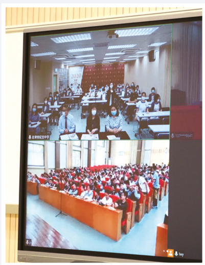
●「悅」讀 FUN 享會盛況

「悅」讀 FUN 享會以「遨遊書海的樂趣」為題,兩校邀請初中同學介紹自己喜愛的書籍,讓大家了解彼此的閱讀習慣,拓寬閱讀領域。在活動中,趙中同學分享勵志書籍,廣揚逆境自強、百折不撓的正向價值觀。蛟川書院的同學則分享實用的閱讀技巧,例如運用腦圖分析《紅樓夢》等小說的複雜人物關係,以及抄錄書中一些至理名言,給自己加深印象。兩校同學又從不同角度分享閱讀的樂趣,有些同學表示透過閱讀獲得啟發,領悟人生哲理,有些同學則認為閱讀有助提升語文造詣,亦讓他們明白到「舊書不厭百回讀,熟讀深思子自知」的道理。兩校教師期望同學能透過活動提升閱讀興趣,並持之以恆,養成終生閱讀的習慣。